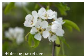
Æble- og pæretræer